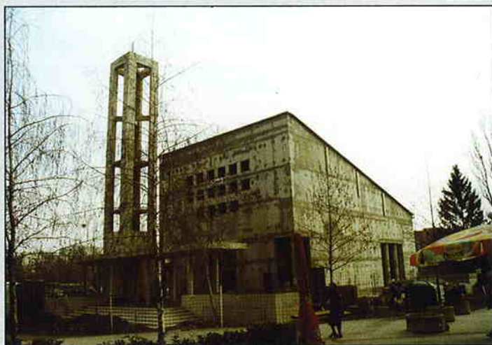
Župna crkva u Soboštini