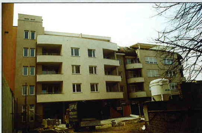
Stambeno - poslovna zgrada u Ogrizovićevoj ulici, Zagreb