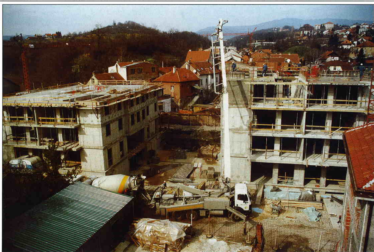
Stambeno - poslovna zgrada na Črnomercu, Zagreb