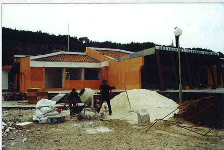
Restoran "Taverna" u turističkom naselju "Kanegra"