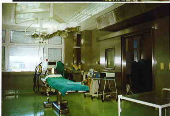
Kirurgija bolnice "Dr. Ivo Pedišić", Sisak