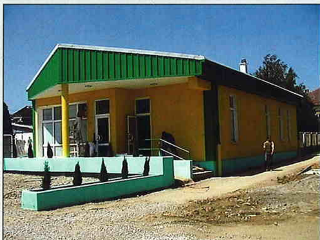
Trgovina mesa i mesnih prerađevina u Križevcima