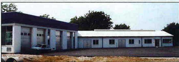
Poslovno-skladišni prostor "Međimurske vode" u Čakovcu