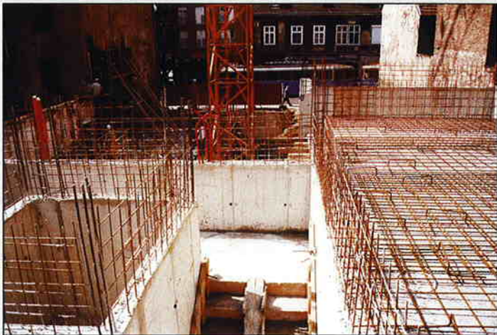
Stambeno-poslovna zgrada u Ilici