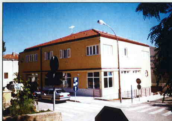
Poslovno-stambena građevina u Baškoj