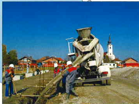
I. FAZA IZGRADNJE OSNOVNE ŠKOLE I SPORTSKE DVORANE U KOTORIBI Investitor: OŠ Kotoriba Površina: 2.298,00 m 2 Radovi završeni u studenom 2004.