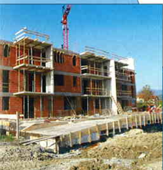
STAVBA NEKRETNOSTI IZ PROGRAMA DRUŠTVENO PROMETNE IZGRADNJE ŠPANSKO 3.1. i 4.1. - Zagreb Investitor: Trius nekretnine d.o.o. Zagreb Površina: 1000,00 m 2 Završetak radova: srpanj 2005.