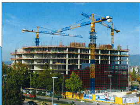
POSLOVNI CENTAR VMD, ulica grada Vukovara - Radnička cesta - Zagreb Investitor: VMD Promet d.o.o. Zagreb Površina: 29.500,00 m 2 Predviđeni završetak radova: prosinac 2004.