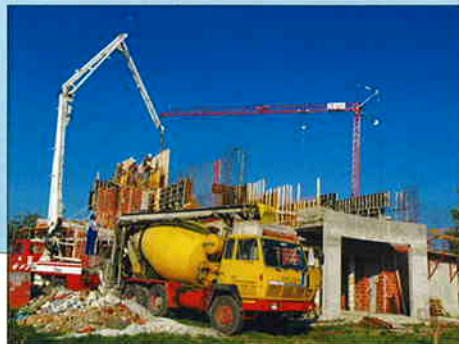
II. FAZA GRADNJE CRKVE U SAVSKOJ VESI Investitor: Biskupija Varaždinska, RKI Župa Marije Pomoćnice Strahoninec Površina: 320,00 m 2 Radovi završeni u studenom 2004.