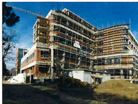
POLIKLINIČKO - STACIONARNI PAVILJON ČAKOVEC Investitor: Županijska bolnica Čakovec Površina: 12.481,00 m 2 Predviđeni završetak radova: listopad 2005.