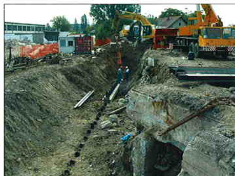
ZEMLJANI RADOVI I ZAŠTITA GRADEVINSKE JAME U SKLOPU IZGRADNJE POSLOVNO - TRGOVAČKOG KOMPLEKSA "ALMERIA" na križanju Vukovarske i Heinzelove ulice u Zagrebu Investitor: Trius nekretnine d.o.o., Zagreb Radovi završeni u studenom 2004.