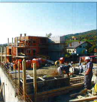
STAVBA VILA ESTINE - Zagreb Investitor: Estine d.o.o. Lučko Završene vile od ukupno 1200,00 m 2 Završetak radova: lipanj 2005.