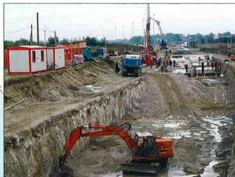
JUŽNA OBILAZNICA GRADA ČAKOVCA Investitor: Hrvatske ceste d.o.o., Zagreb, G.I.U. obilaznica, Čakovec Predviđeni završetak radova: svibanj 2005.