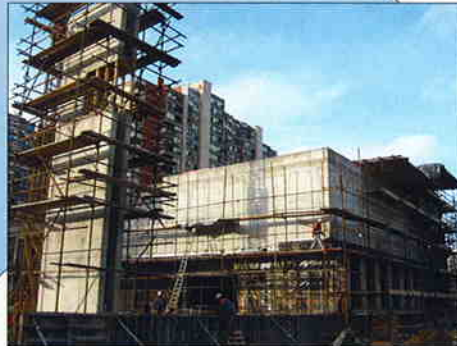
ŽUPNI CENTAR SV. LUKE EVANDELISTA U ZAGREBU - TRAVNO, I. etapa Investitor: Nadbiskupija Zagrebačka RKT župa Sv. Luke Evangelista Zagreb, Travno Površina: 1.825 m 2 Predviđeni završetak radova: prosinac 2006.