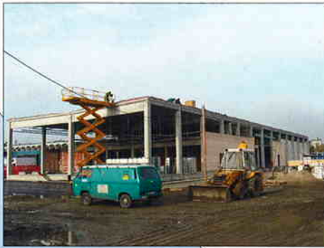
HLADNJAČA, PRERADA I PAKIRNIČA - MESNA INDUSTRIJA VAJDA, Čakovec Investitor: Mesna industrija "Vajda", Čakovec Površina: 2.400 m 2 Predviđeni završetak radova: prosinac 2006.