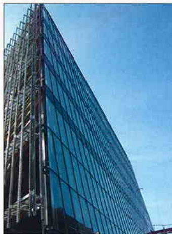
I. FAZA IZGRADNJE I ALU-FASADA BIBLIOTEKE FILOZOFSKOG FAKULTETA SVEUČILIŠTA U ZAGREBU Investitor: Filozofski fakultet Sveučilišta u Zagrebu Površina: 8.050 m 2 Predviđeni završetak radova: prosinac 2006.