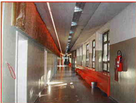
UNUTARNJE UREĐENJE I OPREMANJE FILOZOFSKOG FAKULTETA u Zagrebu završeni u listopadu 2006.