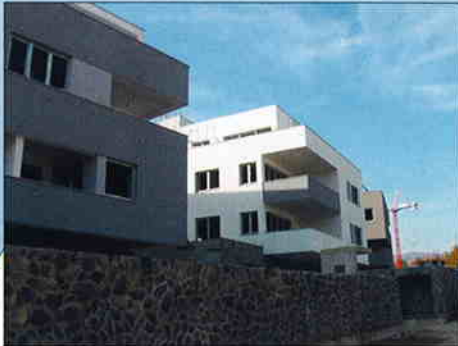
20 STAMBENIH OBJEKATA, ZAGREB, ŠALATA Investitor: VMD Promet d.o.o. Zagreb Površina: 9.800 m 2 Završetak radova: veljača 2007.