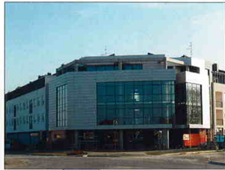
STAMBENO POSLOVNA GRAĐEVINA TRIANGL, Čakovec Investitor: Građevinar d.o.o. Umag Površina: 4.600 m 2 Predviđeni završetak radova: prosinac 2006.