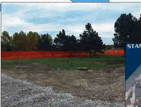
STAMBENO POSLOVNA GRAĐEVINA SESVETE A5, lokacija SOPNICA - JELKOVEC Investitor: Gradsko komunalno gospodarstvo, Zagreb Površina: 8.231 m 2 Predviđeni završetak radova: ožujak 2008.