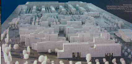
STAMBENO NASELJE SOPNICA - JELKOVEC, SESVETE