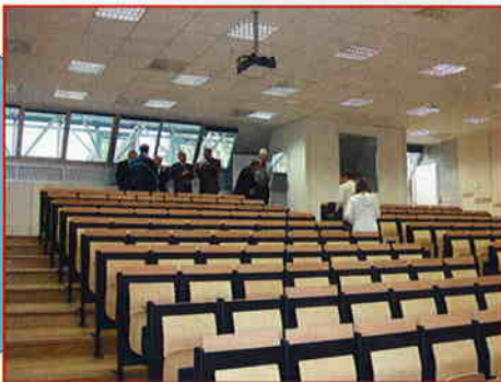
UNUTARNJE UREĐENJE I OPREMANJE NOVE AMFITEATRALNE PREDAVAONICE, BIOMEHANIČKOG LABORATORIJA I NASTAVNIČKIH KABINETA KINEZIOLŠKOG FAKULTETA, Zagreb Investitor: Kineziološki fakultet Sveučilišta u Zagrebu Površina: 500 m 2 Radovi završeni u listopadu 2006.