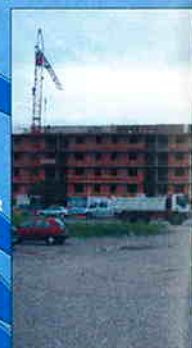
STAMBENO POSLOVA A5, B2, D11 i D12 lok. Investitor: Gradsko Zagreb Površina: 8.231 m 2 Predviđeni završetak