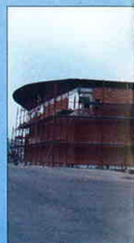
SVETIŠTE SV. MATIJE Investitor: Hrvatska Predviđeni završetak