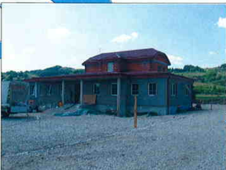
PREGRADA-IZGRADNJA OBJEKATA ZA ODRŽAVANJE CESTA , Ispostava Zagreb Investitor: MGG, gospodarsko interesno udruženje, Čakovec Površina: 325 m 2 Predviđeni završetak radova: srpanj 2007.