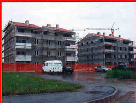
STAMBENE GRADEVINE S-6 i S-7, UMAG Investitor: Građevinar d.o.o. Umag Površina: 1.650 m 2 Predviđeni završetak radova: srpanj 2007.