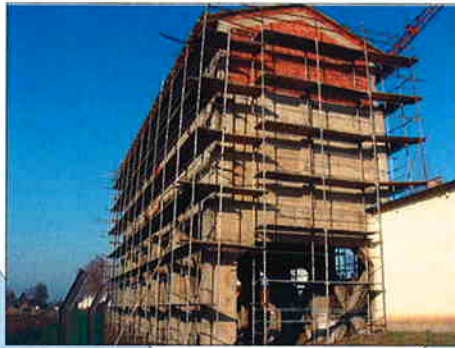
ADAPTACIJA SEPARATORA UGLJENA, MURSKO SREDIŠĆE Investitor: Team d.d. Čakovec