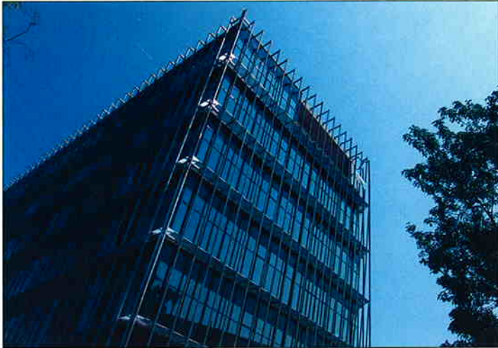
BIBLIOTEKA FILOZOFSKOG FAKULTETA SVEUČILIŠTA U ZAGREBU Tvrtka TEAM d.d. je u razdoblju od studenog 2005. do siječnja 2007. izvršila izgradnju AB konstrukcije i aluminijske fasade objekta Biblioteke Filozofskog fakulteta Sveučilišta u Zagrebu. Ukupna neto površina objekta iznosila je 8.247 m 2 .