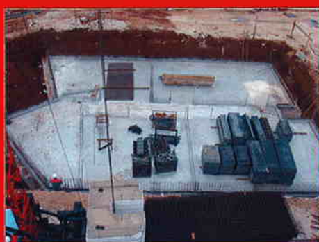
STAMBENA GRADEVINA MOELA-8, UMAG Investitor: Građevinar d.o.o. Umag Površina: 2.637.90 m 2 Predviđeni završetak radova: travanj 2008.