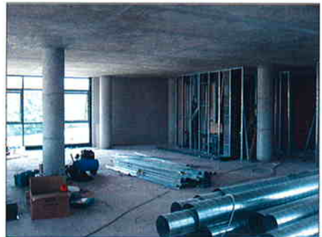
TRIANGUL-UREĐENJE POSLOVNOG PROSTORA Investitor: Team d.d. Čakovec Predviđeni završetak radova: srpanj 2007.