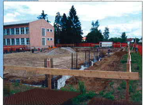
SPORTSKA DVORANA PODTUREN Investitor: Ministarstvo mora, turizma, razvitka Površina: 1.513,22 m 2 Predviđeni završetak radova: svibanj 2008.