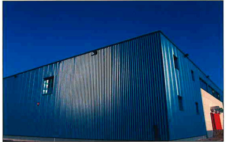
VAJDA Projekt izgradnje HLADNJAČE, PRERADE I PAKIRNICE Mesne industrije "Vajda" Čakovec, završen je u siječnju 2007. g. Objekt površine 2.683 m 2 izgrađen je u roku od 6 mjeseci. INVESTITOR je MESNA INDUSTRIJA VAJDA d.d. Čakovec.