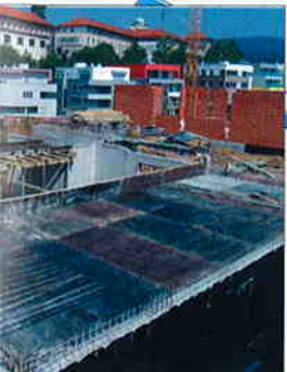
E VILE Zagreb, Šalata et d.o.o. Zagreb