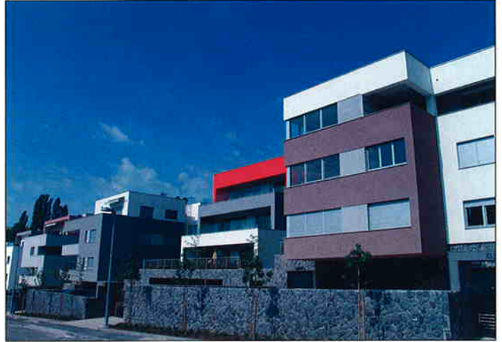
VILE ŠALATA U Zagrebu na Šalati je u ožujku 2006. g. započela izgradnja 19 urbanih vila, od kojih je svaka 697,12 m 2 BRP. Uz njih izgrađen je i bazen, te zgrada sjemeništa ukupne BRP 783.45 m 2 . Investitor je VMD-Promet.