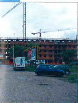
NA GRAĐEVINA SESVETE cijena SOPNICA - JELKOVEC omunalno gospodarstvo.