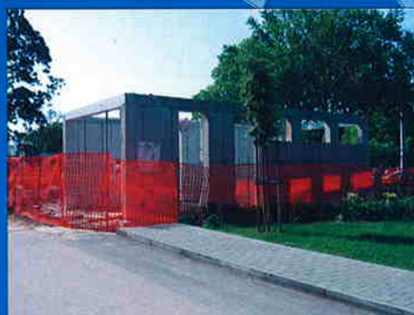
OBJEKAT U KRUGU BOLNICE TURIST HOTELA ZADAR Investitor: Turisthotel d.d. Zadar Površina: 129 m 2 Predviđeni završetak radova: lipanj 2007.