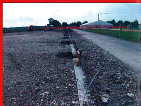
MESAP NEDELIŠĆE Investitor: Mesap d.o.o. Nedelišće Površina: 2.582 m 2 Predviđeni završetak radova: rujan 2007.