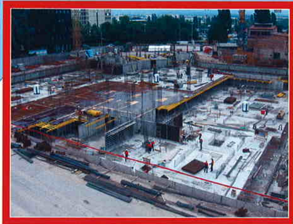
VMD FOLNEGOVIČEVA-RADNIČKA Investitor: VMD Promet d.o.o., Zagreb Površina: 42.549 m 2 Predviđeni završetak radova: travanj 2008.