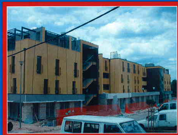
STAMBENO POSLOVA GRADEVINA, Poreč Investitor: Zlatarna AURODENT d.o.o. Zagreb Površina: 5.700 m 2 Predviđeni završetak radova: lipanj 2007.