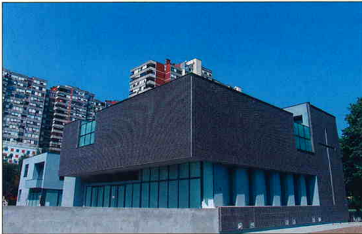
TRAVNO - Župni centar sv. Luke Evangelista, suvremene arhitekture u zagrebačkom naselju Travno, nalazi se između parka, po kojem je naselje dobilo ime i najveće stambene zgrade u Hrvatskoj "Mamutice". Centar čine crkva (1.260,0 m 2 ), župni ured (660,0 m 2 ), te ulazni plato (800 m 2 ) sa zvonikom visine 12 m. Izgradnja je trajala 13 mjeseci. Investitor je Zagrebačka Nadbiskupija, Župa sv. Luke Evangelista.