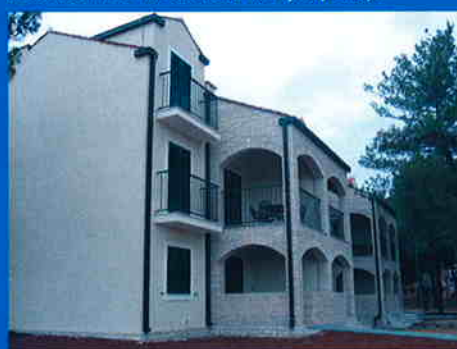
TURISTIČKO NASELJE ZATON, građevina C3 Investitor: TURISTHOTEL d.d. Zadar Površina: 3.000 m 2 Predviđeni završetak radova: ZAVRŠENO