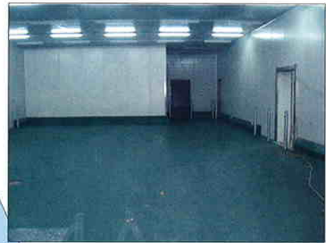
ADAPTACIJA HLADNJAČE RASJEKAVAONICE I PAKIRNICE SVJEŽEG MESA VAJDA Investitor: Mesna industrija Vajda Površina: 1.292,50 m 2 Predviđeni završetak radova: srpanj 2007.