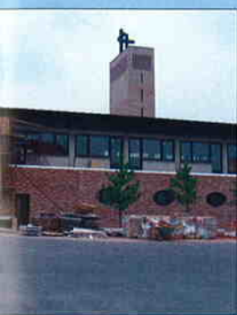
LOBODE - oblaganje fasade Melezijanska provincija radova: srpanj 2007.