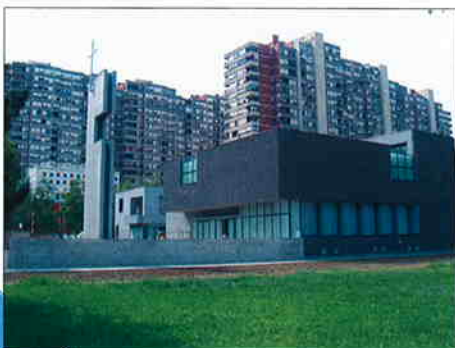
ŽUPNI CENTAR SV. LUKE EVANĐELISTA, Zagreb, Travno - I. etapa Investitor: Nadbiskupija Zagrebačka RKT Župa Sv. Luke Evanđelista Zagreb, Travno Površina: 1.825 m 2 Predviđeni završetak radova: lipanj 2007.