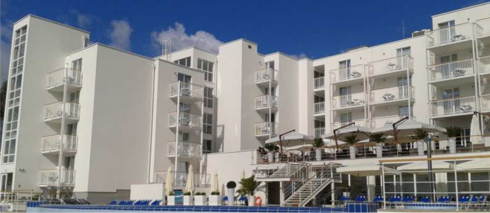
HOTEL SANFIOR I DEPADANSA LANTERNA, RABAC

INFORMATIVNI LIST TVRTKE TEAM d.d. AKOVEC | BROJ 42 | LIPANJ 2013. | GODINA XIX