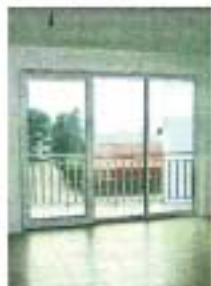
Doručak s pogledom na more