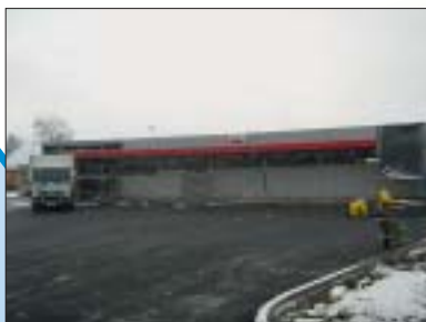
REKONSTRUKCIJA OPSKRBNOG CENTRA METSS, NEDELIŠĆE Investitor: Čakovečki mlinovi d.d. Površina: 507,00 m 2