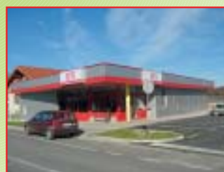
IZGRADNJA OPSKRBNOG CENTRA METSS, LOPATINEC Investitor: Čakovečki mlinovi d.d. Površina: 310,00 m 2 Završeno