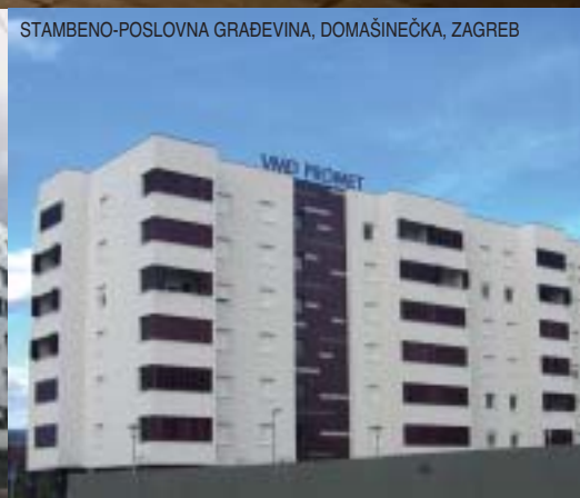
STAMBENO-POSLOVNA GRAĐEVINA, DOMAŠINEČKA, ZAGREB