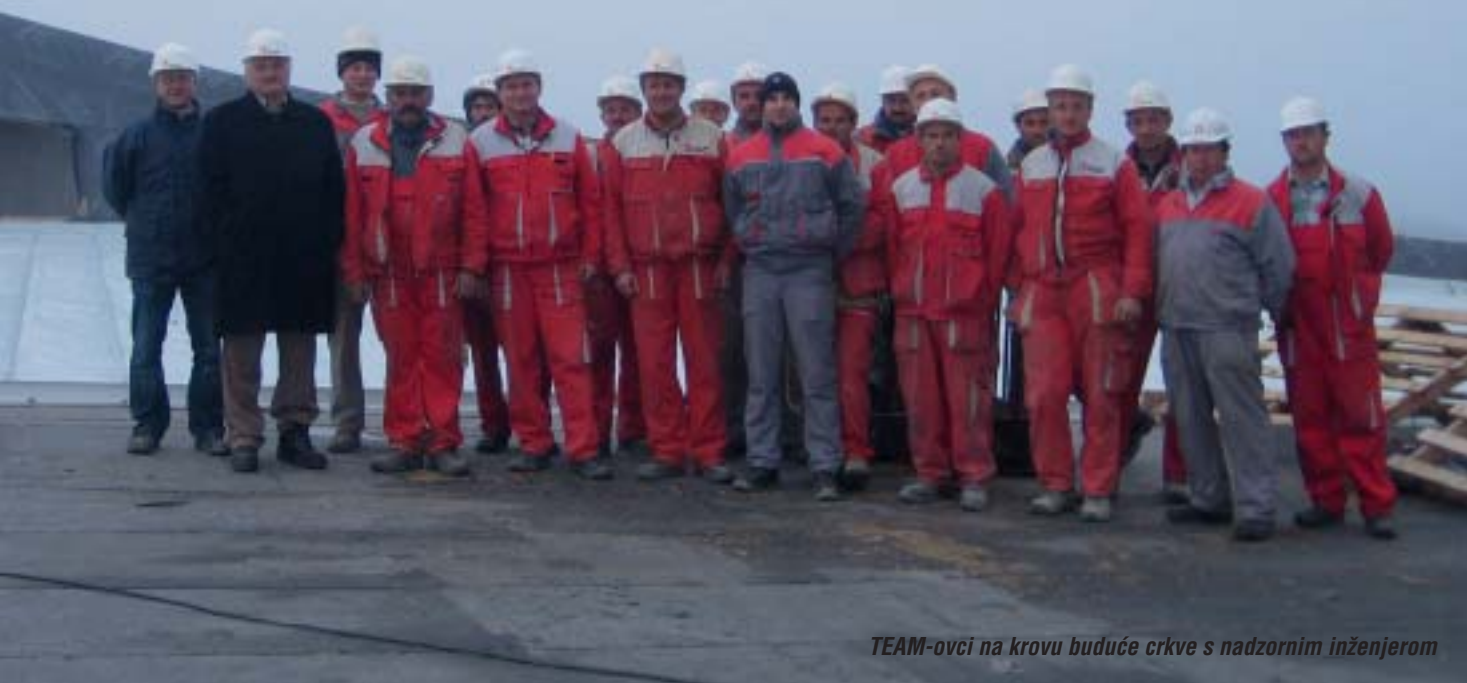
TEAM-ovci na krovu buduće crkve s nadzornim inženjerom