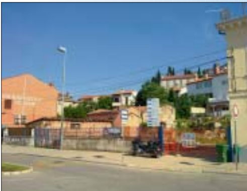
IZGRADNJA STAMBENO-POSLOVNE GRAĐEVINE, ROVINJ Investitor: Abilia d.o.o. Površina: 1.200,00 m 2