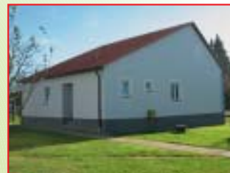
UREĐENJE OBJEKTA VETERINARSKE SLUŽBE, ČAKOVEC Investitor: Mesna industrija Vajda d.o.o. Površina: 116,28 m 2 Završeno