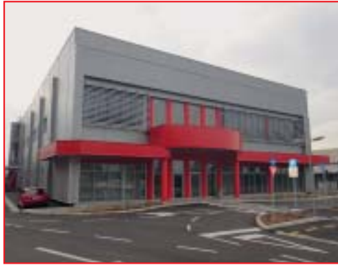
REKONSTRUKCIJA POSTOJEĆE GRAĐEVINE I NADOGRADNJA U SVRHU PRENAMJENE U CENTRALNU KONTROLNU ZGRADU U RN RIJEKA, URINJ Investitor: INA Industrija nafte d.d. Površina: 2.694,38 m 2 Završeno