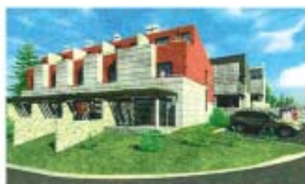
Osim parka uz naselje, svaki će stan imati i svoj dio dvorišta

TEAM je ušao i u poseban program Staffinsen banke pod nazivom "Prostor za preokret", u kojem kupci malih stanova u Umagu na kune kreditne mogu dobiti akcijsku kamatnu stopu 5,95 posto, i to fiksnu na rok od dvije godine, a krediti se odobravaju u punom iznosu cijene stana - ističu u TEAM-u.