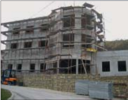
IZGRADNJA STAMBENO-POSLOVNE GRAĐEVINE, ŠKRILE Investitor: Mulino d.o.o. Površina: 1.182,17 m 2