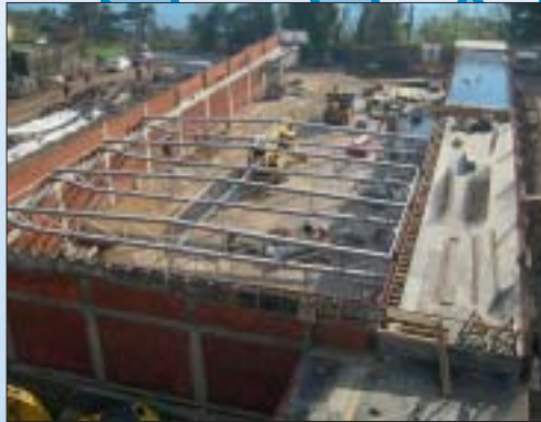
IZGRADNJA DISKONTNE TRGOVINE LIDL, MATULJI Investitor: LIDL Hrvatska d.o.o.k.d. Površina: 1.500,00 m 2