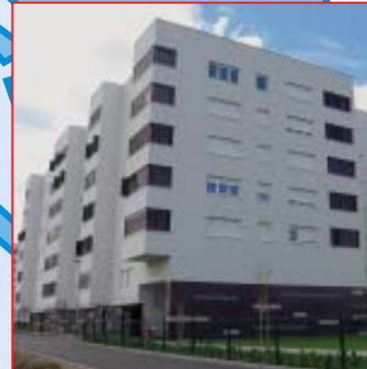
IZGRADNJA STAMBENO POSLOVNE GRAĐEVINE DOMAŠINEČKA, ZAGREB Investitor: VMD PROMET d.o.o. Površina: 12.000,00 m 2 Završeno