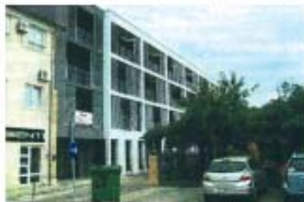
Zgrada u Ulici Pozioi s dizalima i laganim pristupom za invalide

kao kuće u nizu pa svaki stan ima i dvorište. Gradnjom niza htjeli smo izvući prednosti koje proizlaze iz kombinacije zajedničkog, a istodobno i individualnog stanovanja u svojevrsnim obiteljskim kućama - opisuju u TEAM-u projekt koji realiziraju za SP Nekretnima iz Poreča. Na istarskom području čakovečka tvrtka priprema i početak gradnje poslovno-stambene zgrade u Umagu, u Ulici 8. ožujka, uz samu gradsku plaću. (bc).