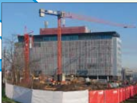
REKONSTRUKCIJA I DOGRADNJA POSLOVNE GRAĐEVINE, ZAGREB Investitor: VIPnet d.o.o. Površina: 1.678,92 m 2