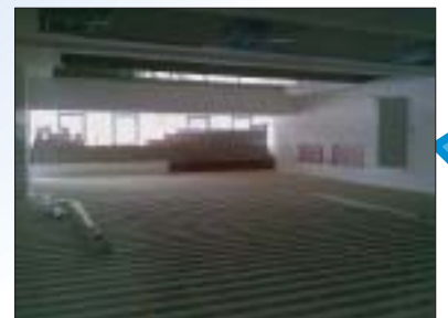
UNUTARNJE UREĐENJE I OPREMANJE INSTITUTA ZA KINEZILOGIJU KINEZILOŠKOG FAKULTETA, ZAGREB Investitor: Kineziološki fakultet Sveučilišta u Zagrebu Površina: 922,00 m 2