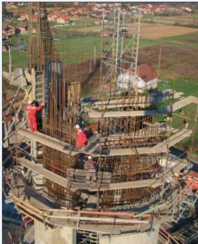
Radovi na zvoniku na visini oko 35 metara

Na gradilištu smo susreli dvadesetak radnika, koji rade na objektu od sredine travnja ove godine, a očekuje se da će radovi naručeni od Teama (grubi građevinski radovi, bez uređenja interijera koji će biti u drugoj fazi projekta) biti gotovi do kraja godine. Dosad smo uglavnom posjećivali projekte stambene ili sportske namjene, pa smo stoga odlučiti posjetiti jednu sakralnu građevinu. Ima li tu kakvih posebnih zahtjeva oko gradnje, pitamo voditelja gradilišta Gorana Debelca .