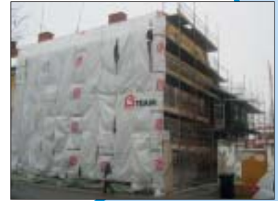
SANACIJA POSLOVNOG OBJEKTA, VARAŽDIN Investitor: Triglav osiguranje d.d. Površina: 300,00 m 2