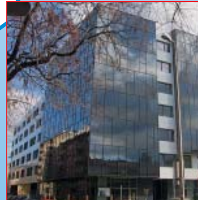
IZGRADNJA STAMBENO-POSLOVNE GRAĐEVINE TUŠKANOVA-VRBANIČEVA, ZAGREB Investitor: VMD Promet d.o.o. Površina: 20.200,00 m 2 Završeno