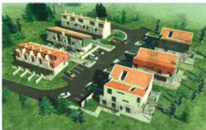
Naselje u Poreču sa šest malih nizova u kojima su ukupno 24 stana od 73 do 173 četvorna metra

Tvrtka TEAM dovršila je stambenu zgradu u Umagu te počela novi stambeni projekt mini naselja u Poreču