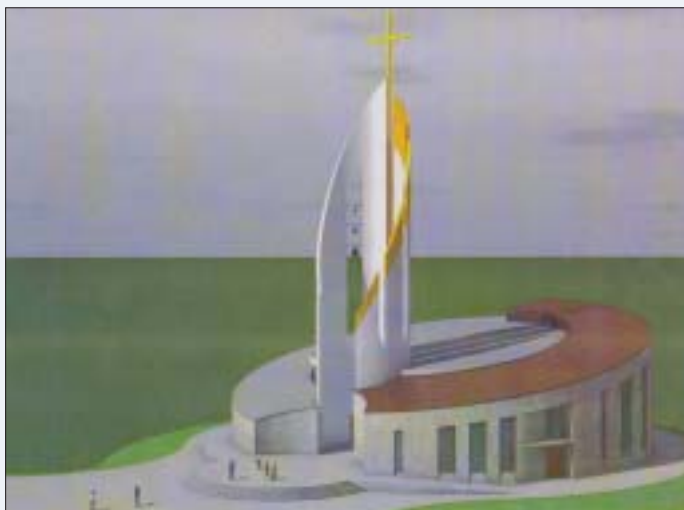
Ovako će izgledati dovršena crkva