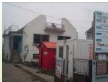
REKONSTRUKCIJA POSTOJEĆE STAMBENE GRAĐEVINE I PRENAMJENA U STAMBENO-POSLOVNU GRAĐEVINU I IZGRADNJA POSLOVNE GRAĐEVINE, NEDELIŠĆE Investitor: Domina-M d.o.o. Površina: 780,00 m 2