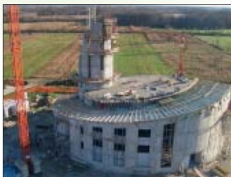
IZGRADNJA RKT. CRKVE UZVIŠENJA SV. KRIŽA SA ŽUPNIM DVOROM I VJERONAUČNO-LAIČKIM OBJEKTOM, DUGO SELO Investitor: Župa Uzvišenja sv. Križa Površina: 1.700,00 m 2