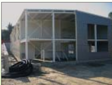
IZGRADNJA POSLOVNE GRAĐEVINE-SKLADIŠTA, SELNICA Investitor: Sport-in d.o.o. Površina: 454,28 m 2