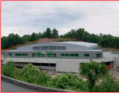
IZGRADNJA ŠKOLSKE SPORTSKE DVORANE, KASTAV Investitor: Grad Kastav Površina: 2.850,00 m 2 Završeno