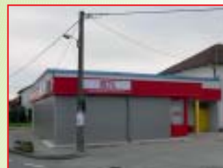
REKONSTRUKCIJA OPSKRBNOG CENTRA METSS, KRIŽOVEC Investitor: METSS d.o.o. Površina: 100,00 m 2 Završeno