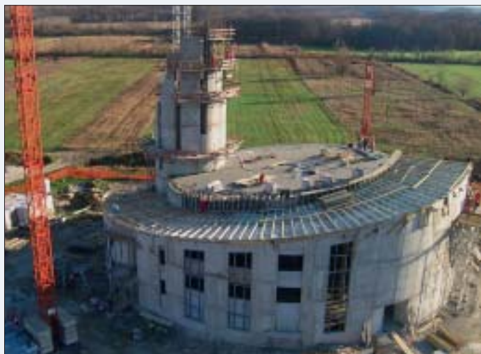
Pogled iz zraka na buduću crkvu

Debelec ističe angažman svih radnika. Na ovakvom projektu potrebna je maksimalna ozbiljnost i trud, i zbog kvalitete, kao i sigurnosti samih radnika jer se radi na ogromnim visinama a u tom dijelu se doista ne prepušta slučaju. Tako smo tijekom posjeta na gradilištu zatekli stručnjaka za zaštitu na radu Nenada Hampamera u provođenju alkotesta kod svih radnika, kao i Nikolu Kovačića zaduženog od Uprave za praćenje roka i kvalitete u kontroli izvršenog posla. Da su radnici doista odgovorni pokazalo je alkotestiranje jer je kod svih alkometar pokazao brojku 0,0. Voditelj gradilišta je zadovoljno konstatirao kako su na izgradnji objekta zaposlenici iskazali maksimalnu ozbiljnost i odgovornost te se time dokazuje kako su Teamovci sposobni graditi i ovakve objekte, ne toliko velike po kvadraturi, koliko po iznimnoj složenosti gradnje kakvu mogu ispuniti samo najkvalitetnije građevinske tvrtke.