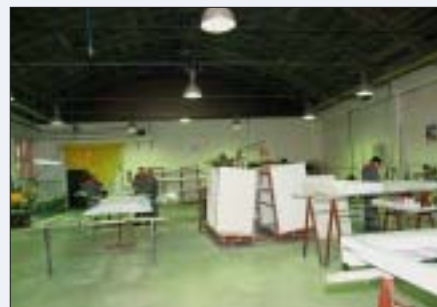
Pogon ALU i PVC stolarije

Sam sektor zasebna je profitabilna jedinica i vrlo je sveobuhvatan jer sadrži u sebi brojne poslovne aktivnosti od uske suradnje sa tehničkom pripremom rada, preko pripreme i realizacije projekata unutar ugovorenih finansijskih okvira, rokova i kvalitete, do pružanja usluga službi pri realizaciji projekata unutar poduzeća, a ponekad šire.