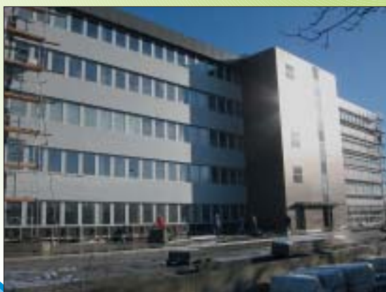
IZGRADNJA UPRAVNE ZGRADE LIDL-a, VELIKA GORICA Investitor: LIDL Hrvatska d.o.o.k.d. Površina: 4.900,00 m 2