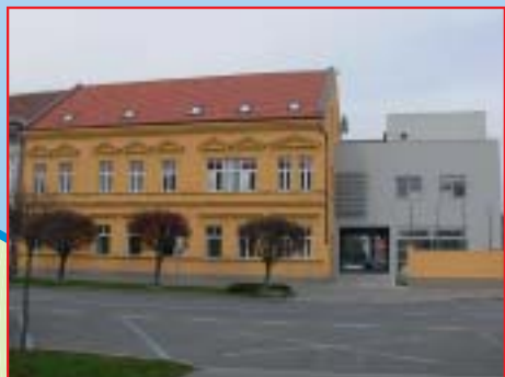
REKONSTRUKCIJA I DOGRADNJA UPRAVNE ZGRADE, PRELOGU Investitor: Ministarstvo regionalnog razvoja, šumarstva i vodnog gospodarstva i Grad Prelog Površina: 1.368,60 m 2 Završeno