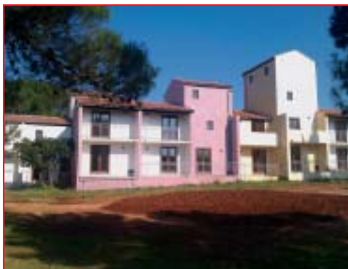
ADAPTACIJA SMJEŠTAJNIH JEDINICA U TN VILLAS RUBIN, ROVINJ Investitor: MAISTRA d.d., Rovinj Površina: 3.666,00 m 2 Završeno