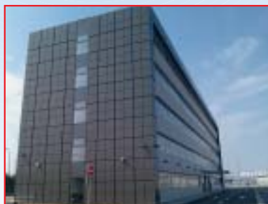
IZGRADNJA UPRAVNE ZGRADE, VELIKA GORICA Površina: 4.900,00 m 2 Završeno