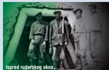
Ispred rudarskog okna...

EU provede izbor Europske (turističke) destinacije izvrsnosti. Opći ciljevi projekta su, uz ostalo, bili promicanje europskog turizma, stvaranje svijesti o raznolikosti i kvaliteti europske turističke ponude, promicanje svih zemalja i regija, ublažavanje sezonalnosti te pokušaj da se izbalansiraju turistički