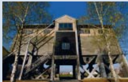
Spomen dom rudarstva

Ovaj izbor se provodi od 2005. kada je Europski parlament predložio Europskoj komisiji da se u