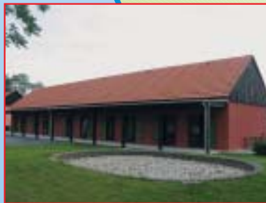
I. FAZA REKONSTRUKCIJE I PRENAMJENE GRAĐEVINE U SMJEŠTAJNE JEDINICE, MURSKO SREDIŠĆE Investitor: TEAM d.d., Čakovec Površina: 300,00 m 2 Završeno