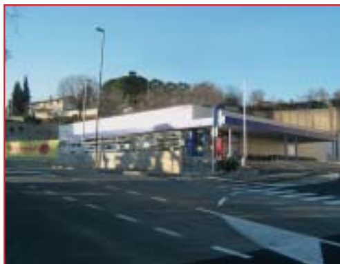
IZGRADNJA DISKONTNE TRGOVINE, MATULJI Površina: 1.500,00 m 2 Završeno