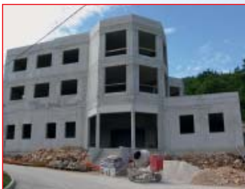
IZGRADNJA STAMBENO-POSLOVNE GRAĐEVINE, ŠKRILE Investitor: Mulino d.o.o., Škrile Površina: 1.182,17 m 2 Završeno