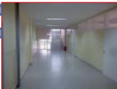
ADAPTACIJA INSTITUTA ZA KINEZILOGIJU NA KINEZIOLŠKOM FAKULTETU, ZAGREBU Investitor: Kineziološki fakultet Sveučilišta u Zagrebu Površina: 922,00 m 2 Završeno