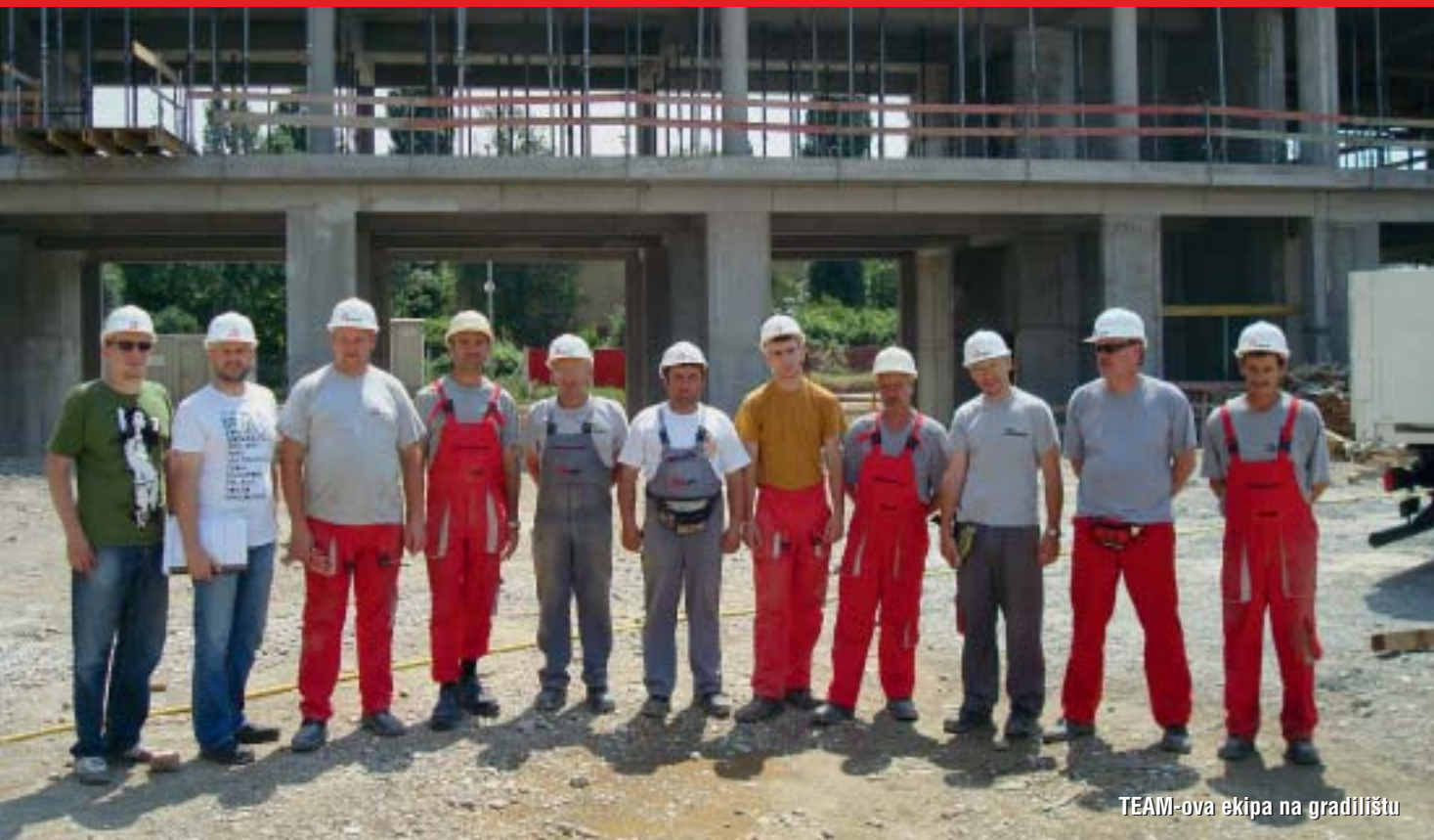
TEAM-ova ekipa na gradilištu

zahtjevan zbog konstrukcije koja je visine 5,75 metara u prizemlju, dok je visina katova 4,70 metara. U projektu se zbog njegove namjene javlja dosta izmjena, pa moramo biti u redovitom kontaktu i s investitorom i s projektantima i nadzornim inženjerima kako bi sve te izmjene uskladili.