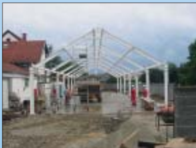
IZGRADNJA POMOĆNE PROIZVODNE GRAĐEVINE, PRELOG Investitor: VUPAK d.o.o., Prelog Površina: 285,00 m 2

IZVOĐENJE PREFABRICIRANE AB KONSTRUKCIJE NA GRAĐEVINI ZAVARENIH PROIZVODA, ŠENKOVEC Investitor: EKO MEDIMURJE d.d., Šenkovec