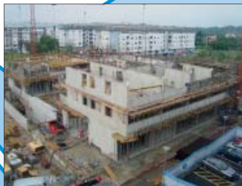
IZGRADNJA STAMBENO-POSLOVNE GRAĐEVINE, CENKOVAČKA, ZAGREB Investitor: VMD promet d.d., Zagreb Površina: 12.000,00 m 2