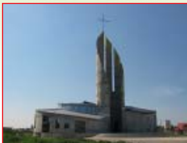
IZGRADNJA CRKVE UZVIŠENJA SV. KRIŽA, DUGO SELO Investitor: Župa Uzvišenja sv. Križa, Dugo Selo Površina: 1.700,00 m 2 Završeno