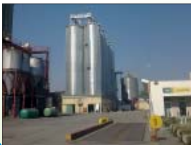
GRAĐEVINSKI RADOVI NA IZGRADNJI SILOSA I USIPNOG KOŠA, ČAKOVEC Investitor: Tvornica stočne hrane d.d., Čakovec Površina: 600,00 m 2