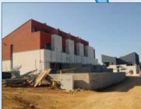
IZGRADNJA STAMBENIH GRAĐEVINA, NASELJE GULIĆI, POREČ Investitor: S.P. Nekretnine d.o.o., Poreč Površina: 2.113,00 m 2