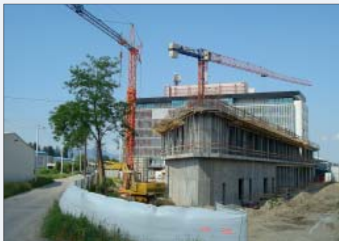
Pogled na objekt sa stražnje strane

U ovom objektu bit će smješten glavni agregat koji zauzima najveći dio energetskog prizemlja, trafostanice, niskonaponski razvodi, soba za smještaj UPS-a, elektro soba, strojarstva klima uređaja i protupožarne stanice - dio su na kojem je naglasak na izgradnji objekta, zbog povećane potrebe za energijom i kvalitetnijeg i sigurnijeg funkcioniranje VIPnet-ove mreže. Ovaj energetski i tehnički dio odnosi se na prizemlje i prvi kat, dok će ostala dva kata biti namijenjena za uredske prostorije - pojašnjava nam voditelj gradilišta Hrvoje Rigler , mladi dipl. inženjer iz Zagreba, kojem je ovo prvi projekt po dolasku u TEAM.