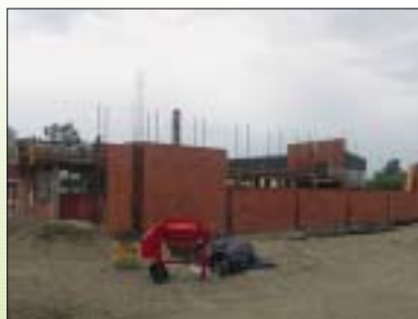
IZGRADNJA POSLOVNE GRAĐEVINE, PUŠČINE Investitor: ELTING d.o.o., Pušćine Površina: 1.400,00 m 2

IZVOĐENJE PREFABRICIRANE AB KONSTRUKCIJE NA GRAĐEVINI ZAVARENIH PROIZVODA, ŠENKOVEC Investitor: EKO MEDIMURJE d.d., Šenkovec