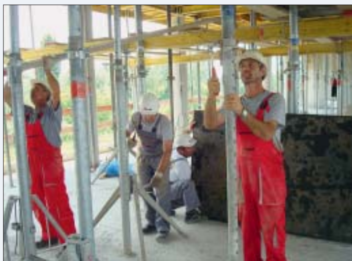
TEAM-ovi tesari u radnom okruženju