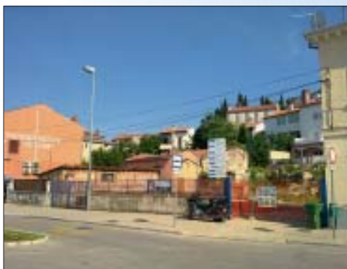
IZGRADNJA STAMBENO-POSLOVNE GRAĐEVINE, ROVINJ Investitor: Abilia d.o.o., Rovinj Površina: 1.200,00 m 2