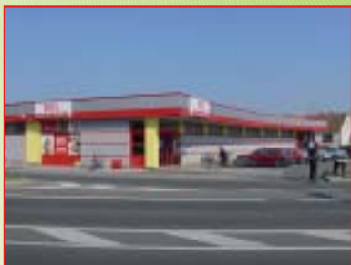
REKONSTRUKCIJA OPSKRBNOG CENTRA METSS, NEDELIŠĆE Investitor: Čakovečki mlinovi d.d. Površina: 507,00 m 2 Završeno