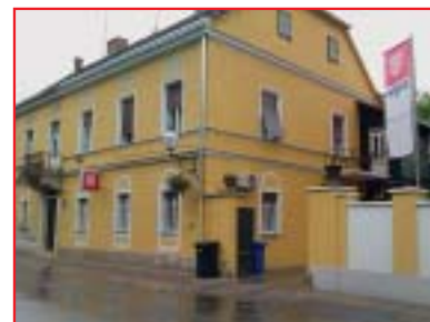
SANACIJA POSLOVNOG OBJEKTA, VARAŽDIN Investitor: Triglav osiguranje d.d., Zagreb Površina: 500,00 m 2 Završeno