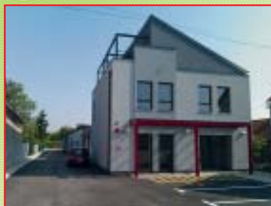
REKONSTRUKCIJA POSTOJEĆE STAMBENE GRAĐEVINE I IZGRADNJA POSLOVNE GRAĐEVINE, NEDELIŠĆE Investitor: DOMINA-M d.o.o., Čakovec Površina: 780,00 m 2 Završeno