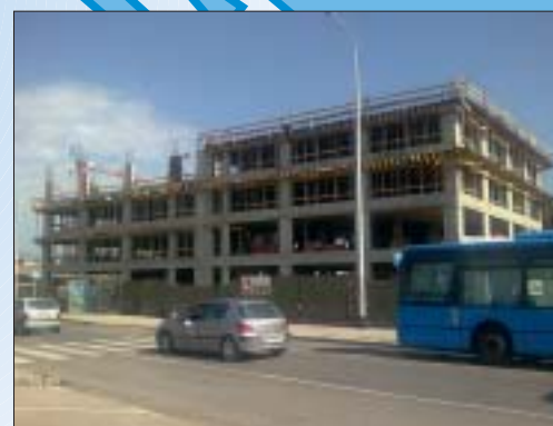
IZGRADNJA STAMBENO-POSLOVNIH GRAĐEVINA G3, G4, G5 SESVETE, ZAGREB Investitor: RB SUPERMETALI d.o.o., Sesvete Površina: 7.200,00 m 2